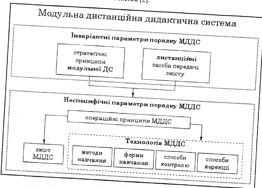
Рис. 1. Характеристики МДДС

Розглянемо характеристики еталонної моделі МДДС (Рис. 1) у термінах еволюційного підходу до аналізу дидактичних систем [2]: